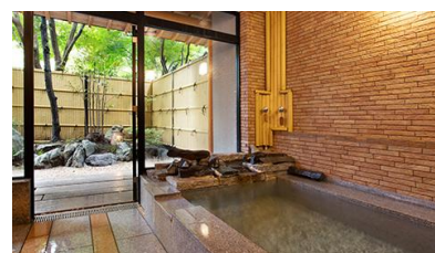
友琴(ゆうきん・石造り)

<伝統芸能「山中節の夕べ」公演> 北前船の栄えた頃より、唄い継がれる温泉民謡です。漁師たちが遠く北海道への出稼ぎ中に覚えた「追分節」。冬に湯治へ来た際に漁師たちが湯に浸かりながら唄っていたのを、外で聞いていた浴衣娘(ユカタパー)が聞き惚れ、山中訛りで真似たのが始まりとされています。「山中座」に出演する芸妓たちが情緒漂う舞唄を披露します。