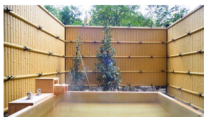
一笑(いっしょう・檜造り)

<貸切風呂 50 分無料> 趣の異なる檜・岩・石造り(バリアフリー)3種の貸切風呂は、ご滞在中1回50分無料。バスタオルやアメニティ類を完備、源泉より引くまるやかな湯をプライベート感覚でお楽しみください。