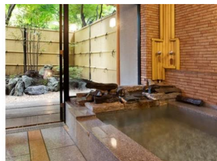
「友琴 (ゆうきん)」石造り