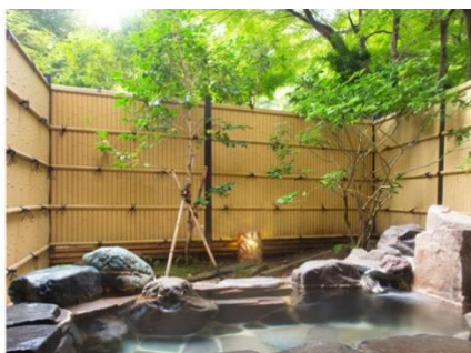
「竹雀 (ちくじゃ)」岩造り