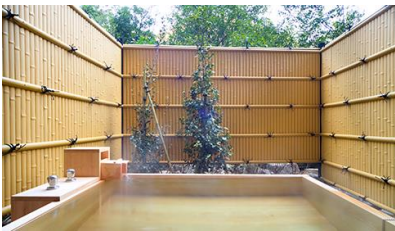
一笑(いっしょう・檜造り)

趣の異なる檜・岩・石造り(バリアフリー)3種の貸切風呂は、ご滞在中1回50分無料でご利用いただけます。バスタオルやアメニティ類も完備し、源泉より引くまるやかな湯をプライベートでお楽しみください。