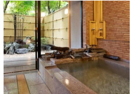
「一笑 (いっしょう)」檜造り