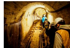
黒部峡谷パノラマツアー