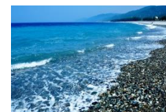
ヒスイ海岸（朝日町）