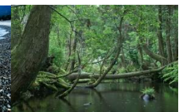
杉沢の沢スギ（入善町）