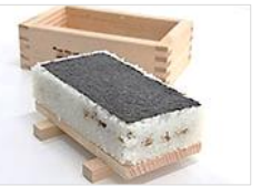
郷土料理「押せ寿し」