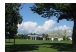
YKK センターパーク（黒部市）