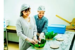
ます寿司手作り体験