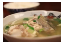
ソウルフード「タラ汁」