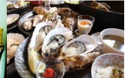
深層水仕込み牡蠣

【朝日町】～おだやかな風景が、時間をゆるめる。どこかなつかしい、ふるさとのようなまち～