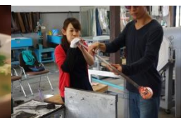
なないろ KAN 吹きガラス体験