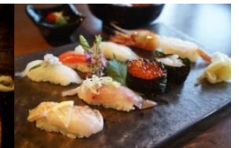
魚の駅「生地」寿しランチ