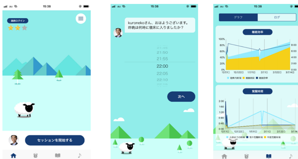
(アプリの画面イメージ)

当社は、この睡眠問題解消アプリの販売を皮切りに、従業員向けのソリューションの開発を強化してまいります。