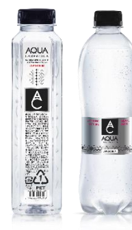
AQUA Carpatica ナチュラルミネラルウォーター