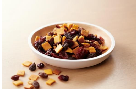
盛り付けイメージ