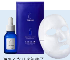
※無くなり次第終了

http://pr1.takami-labo.com/lp3/s046b/index.html