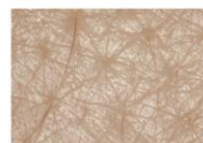
〈使用后〉 肌のキメが三角に整い、 均一に美しく並んでいる