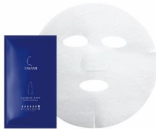
※タカミスキンピール併用製品