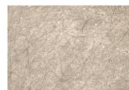
〈使用前〉 肌のキメが乱れ 流れた状態