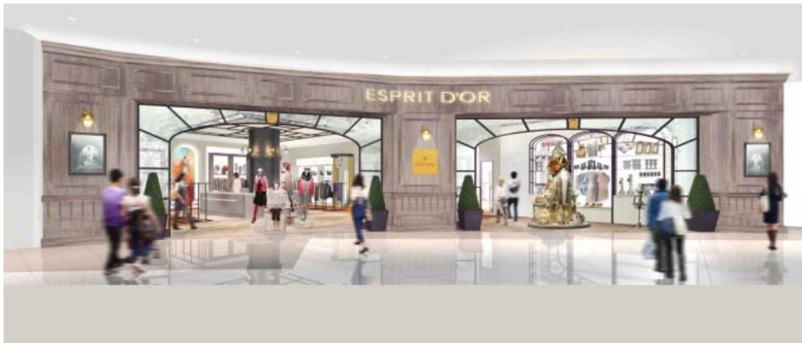
「エスプリドール」イオンモール幕張新都心店 イメージ(パース)

結婚、出産、子育てなど、さまざまな経験を重ね、日常のあらゆるシーンの中にも「美しさ」と「華やかさ」を忘れない大人の女性に向けて Femininity な世界観を大切にしながら、複数ブランドを編集し、アパレルからファッション雑貨、生活雑貨を含めて、フレンチテイストのライフスタイルを提案します。