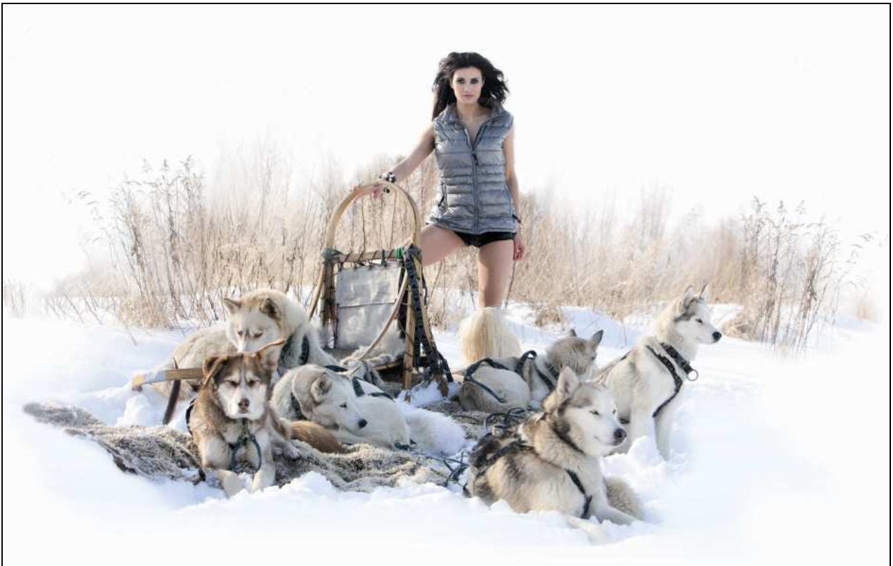
<「Yeti」2013年秋冬イメージビジュアル>