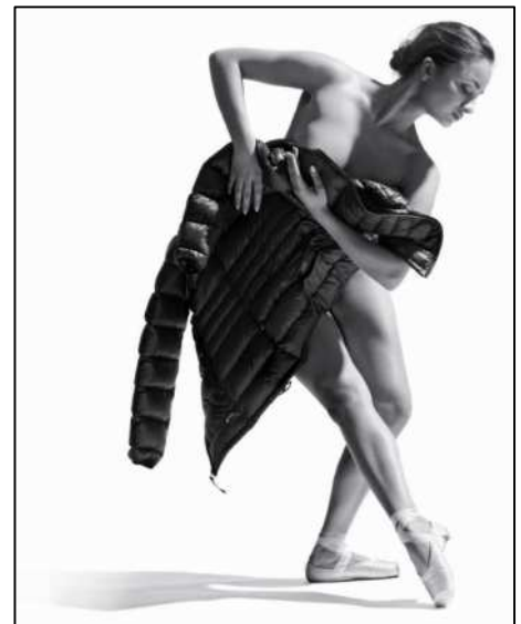
超軽量ダウンウェアを得意とする「イエティ」

当社では、ファッション感度の高い消費者を中心に近年注目が高まる高級ダウンウェアへのニーズに対応し、ヨーロッパで30年の実績を持つ「イエティ」の国内での取り扱いを開始すると共に、今後は日本の顧客に合わせたオリジナルラインの開発も視野に入れて展開します。