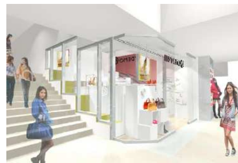
駅のコンコースに面し、いつでも立ち寄れる ファッション・コンビニエンス・ストア

多くの人が行き交う駅立地の中で、女性がふと足を向けたいくなる“新宿の丘”をショップコンセプトに白とウッドを基調に、グリーンをアクセントカラーにした新宿ならではの店舗アトモスフィー。