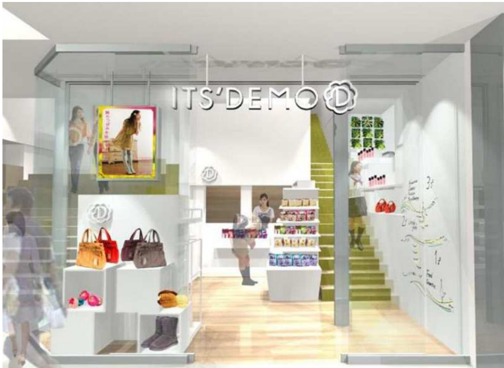
6/9(土)リニューアルオープンする新宿ミロード店／1・2階 25坪(82.5㎡)