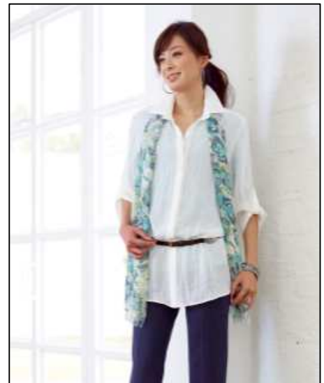
上品で若々しい日常着として人気の「エッシュ」

本格的な盛夏に向けては、流行の麻やソフトで軽い綿など天然素材に加え、暑い夏を涼しく過ごして頂けるクール素材やイージーケア性に優れた素材で、パンツをメインアイテムに、ジャージプルオーバーやシャツ、羽織のカーディガンなどとコーディネートして上品ですっきり着られるスタイルを提案します。