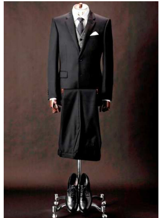
ウォームビズ対応セットアップスーツ 大人の品格が漂うブリティッシュモデル。

ジャケットの裏地には、太陽光線を熱エネルギーに換える「オプトライニス」と、細糸が生む抜群のすべりと光沢のある「レジェスタ」を合わせた、蓄熱保温効果のある素材「LEGERSTA® OPTLINIS® / レジェスタ® オプトライニス®」を使用、トラウザーズの膝裏には、赤外線を吸収し熱エネルギーに換える、蓄熱保温効果のあるポリエステル素材「Feelthermo / フィールサーモ」を使用。