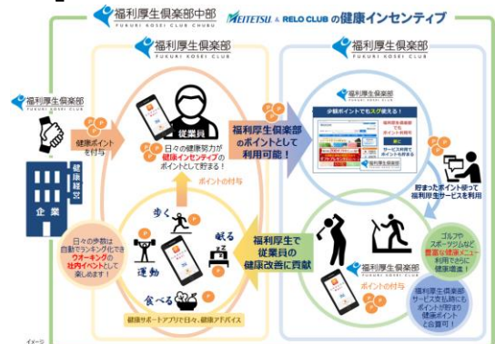
▲福利厚生倶楽部の「健康インセンティブ」詳しくは会場で!