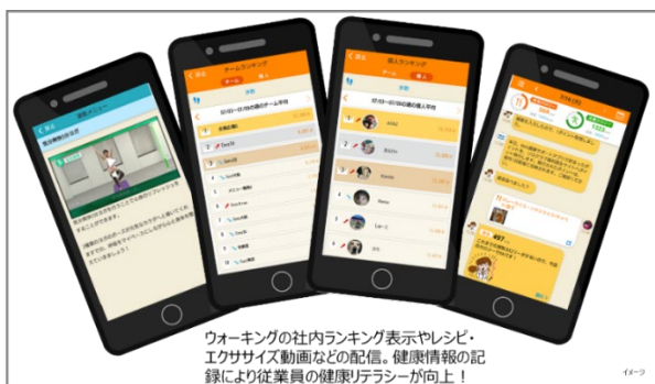
▲Relo健康サポートアプリを活用し従業員の行動変容を促したり、社内ウォーキングイベントなどを実施

「Relo 健康サポートアプリ」は“食事”“運動”“情報提供”の大きく3つの側面から AI アシスタントがタイム