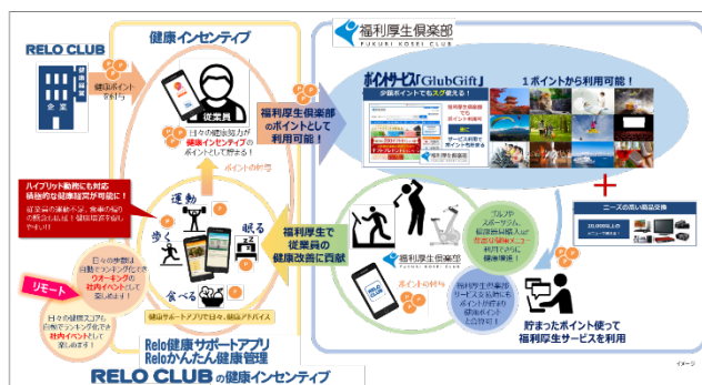
▲「Relo健康サポートアプリ」健康インセンティブを活用した福利厚生サービスをプラットフォーム化した健康好循環の確立

そして、「Relo 健康サポートアプリ」を使用したイベントでは「健康インセンティブ」の仕組みから、入賞者やチームへ健康ポイントが付与されました。「健康インセンティブ」は、日ごろの「Relo 健康サポートアプリ」への入力や運動達成などに応じてポイントを得ることができます。こうした日常の健康増進活動や健康イベントで貯まった健康ポイントは、「福利厚生倶楽部」のポイントサービス「クラブギフト」と合算され、「福利厚生倶楽部」のサービス利用に充てることができます。健康を意識し始めた従業員は頑張ってきたポイントで新たにスポーツジムのサービス利用、運動補助器具の購入など自発的に健康好循環を歩み始める結果となっていました。