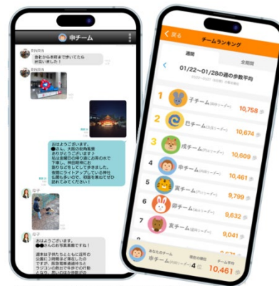
▲ウォーキングイベントは健康推進担当が毎回、チーム分けを工夫。普段、接点の少ない従業員が交流でき、コミュニケーションの活性化が図れる

また、イベントを通じた交流をさらに深めるため、日常的に利用しているビジネスチャット内にチームごとのルームを作成。参加者がウォーキング中の写真を投稿したり、互いに励ましあったりすることで、新たな絆が生まれました。この取り組みにより、従業員同士の理解が深まり、新たな発見があっただけでなく、その後の業務の円滑化にもつながりました。