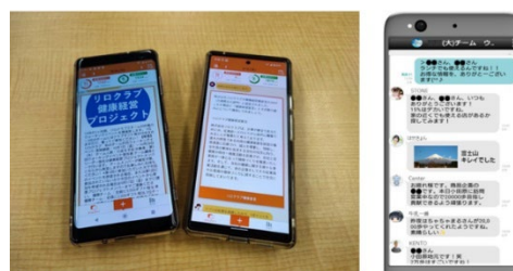
▲Relo健康サポートアプリのお知らせ機能にて「健康経営宣言」をはじめ様々な情報を全従業員へ発信。健康経営プロジェクトの周知を図る

▶ ビジネスチャット JobTalk https://www.reloclub.jp/service/jobtalk/