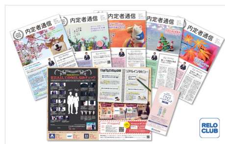
▲ご利用ハンドブック(8月)と内定者通信(11月～3月まで5回発行)

これらの福利厚生サービスを通じて、学生は内定企業への帰属意識を高めやすくなり、人事担当者とのコミュニケーションを活発化するツールとしても最適です。