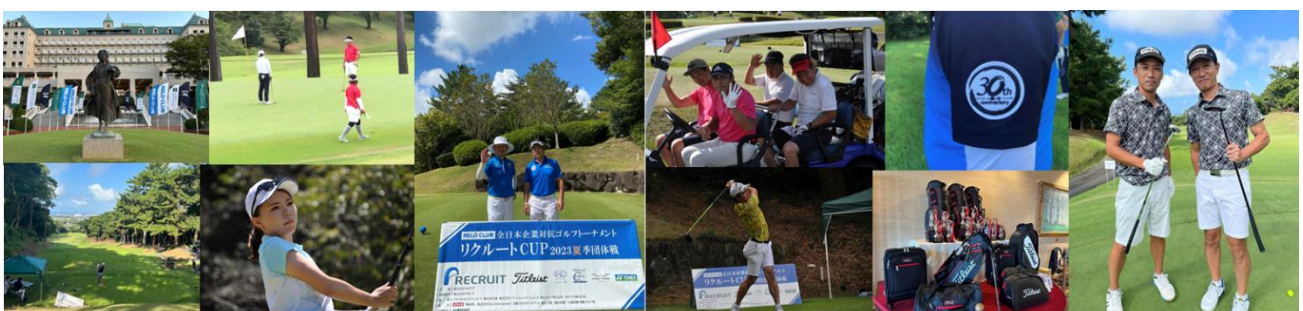
▲夏季団体戦2023の様子

コロナも終息し、人々が心よりスポーツを楽しめる日常を取り戻し始めた今日、人と人とのつながりが希薄になりがちになっていた部分を、本大会が異業種交流の場として、また、社会人の安全なコミュニケーションツールとして、年齢・性別に関係なく社内外で活用することを期待しております。そして、本大会を通じて生まれる有意義なひとときが、友情、連帯感、フェアプレイの精神を育み、運動不足解消、健康増進と生涯スポーツのさらなる充実に貢献し、企業が目指す健康経営※ 1 の支援につながるよう、これからも努めてまいります。