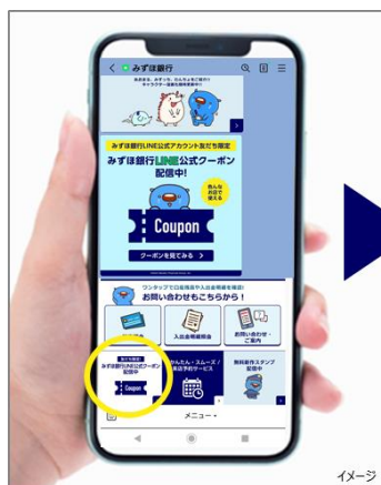
▲みずほ銀行LINE公式アカウント

みずほ銀行 LINE 公式アカウントの本来機能に加えて、日常にお使いいただけるクーポン提供の充実により、会員(友だち)の満足度の向上に寄与することを目的とした取り組みとなっております。