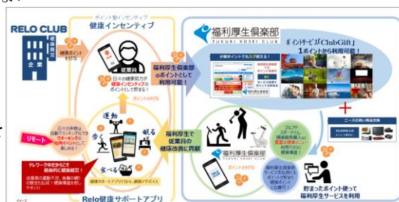
▲Relo健康サポートアプリが健康インセンティブ活用、健康プラスへの確立

など、健康経営や健康増進管理にご興味のある担当者の方へは、健康経営アドバイザー※2 が具体的な成功例を交えてお悩みのご相談を承り、“従業員エンゲージメント”を高めるお手伝いをいたします。