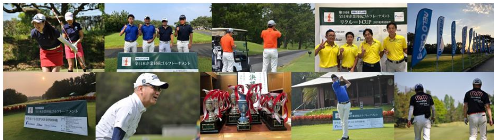
▲RELO CLUB全日本企業対抗ゴルフトーナメント 過去大会の様子

また、本大会の上位になると、年1回開催される個人戦全国大会や世界大会を目指せるダブルス戦などに出場することも可能で、さらに楽しみが増します。