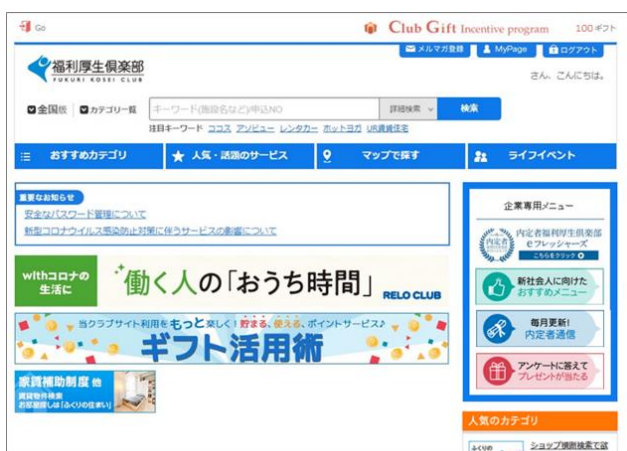
▲内定者福利厚生倶楽部会員専用サイトTOPイメージ

講座数 標準 26 講座 (2021年9月30日現在) 講座内容 ビジネスマナー、ビジネススキル 社会人基礎強化力 ビジネススキル Office 基礎 (Word、Excel、PowerPoint 基礎講座) ・グループウェア (お知らせ、掲示板、スケジュールなど)