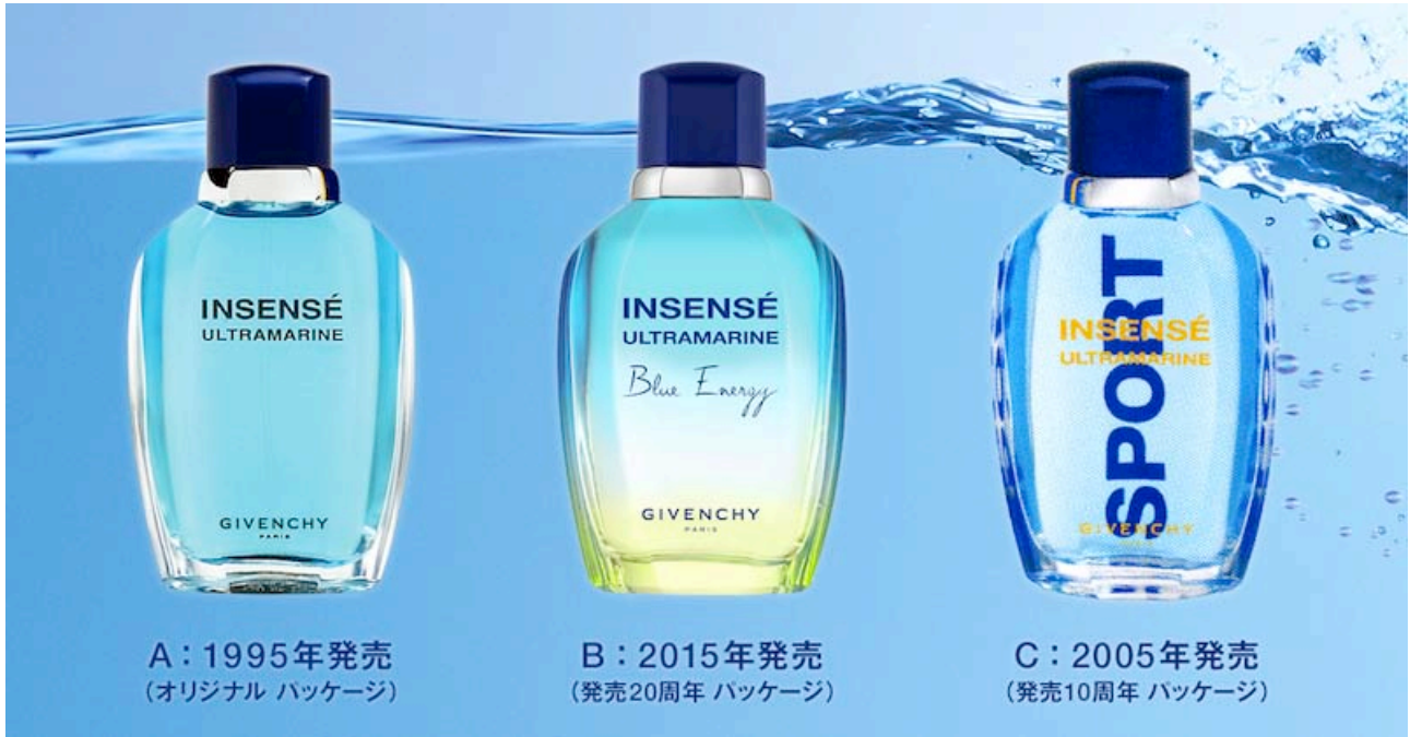
A : 1995年発売 (オリジナル パッケージ)