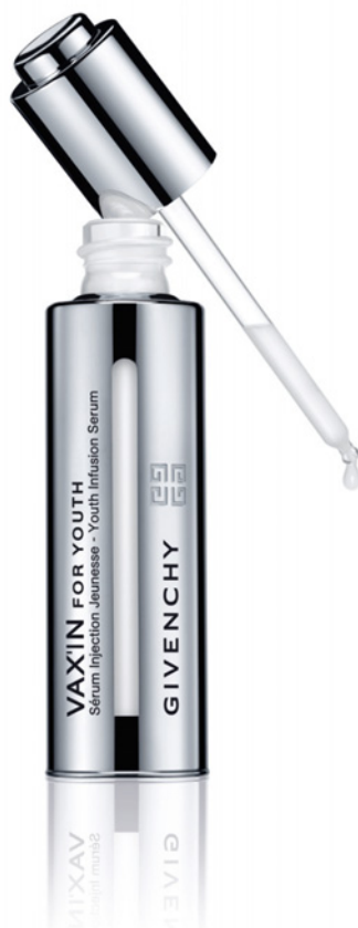
VAX ユース セラム