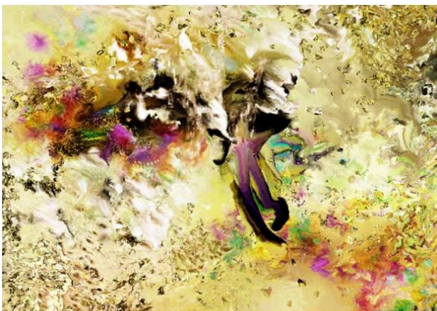
Bloomy Girls' All sound and visuals by Takagi Masakatsu, 2005

ジバンシイの永遠のテーマである“エレガンス”、“大胆”、“強さ”、“官能”を受け継ぎながら息をのむほどに完璧な現代のジバンシイを表現したニコラ・ドゥジェンヌは、『Bloomy Girls』の色彩あふれるいきいきとした躍動感に独自の新解釈を加え、移ろう季節にコントラストをなす鮮やかな色彩を映し出しました。