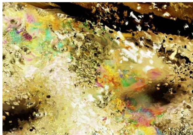
Bloomy Girls' All sound and visuals by Takagi Masakatsu, 2005