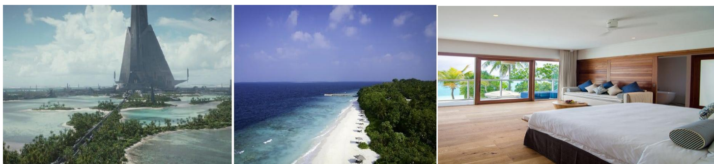
(左：劇中シーン 中央：モルディブ 右：HomeAway物件)

スピンオフとなる『ローグ・ワン／スター・ウォーズ・ストーリー』で帝国軍と反乱軍の争いが繰り広げられるのは、熱帯の惑星スカリフ。撮影地に選ばれたのは、地上の楽園という名にふさわしいモルディブ共和国。ホームアウェイにはモルディブのヴィラも掲載されており、こちらの物件は広々としたプライベートプールを完備。もちろんビーチまでも数歩でアクセスできます。ベッドの上に寝転んだまま海を眺められる開放感が素敵です。このレジデンスは話題のラグジュアリーリゾート、アミラフシの中にあり、ハイレベルな施設を使えるのも魅力。日常を忘れて楽園を感じながらSWシリーズの世界も味わえるこちらの家は、1泊604,156円。最大宿泊人数8人で泊まると、1人あたり約75,520円です。