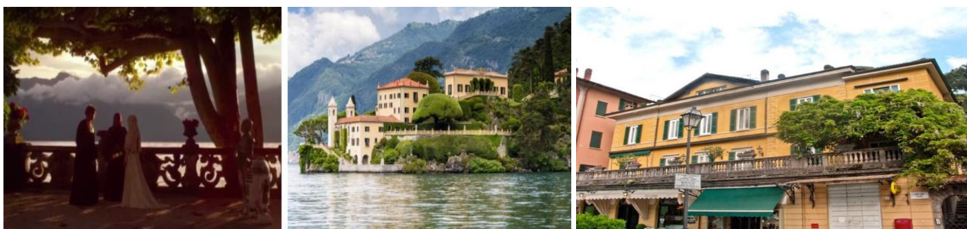
（左：劇中シーン 中央・右：HomeAway物件）

『エピソード2 / クローンの攻撃』で、アナキン・スカイウォーカーとパドメ・アミダラの結婚式が行われた場所は惑星ナブー。彼らが湖からの逆光を受けて見つめ合うシーンはとても美しく、多くの人の記憶に残っているはずです。このシーンはイタリア北部の高級避暑地、コモ湖畔のバルビアンネッロ邸で撮影されました。邸宅はコモ湖に向かって突き出した岬に立ち、せり出したバルコニーは湖上に浮かぶ舞台のよう。アナキンとパドメのように、ロマンティックなひとときを過ごせそうなコモ湖畔の物件は1泊56,457円。最大宿泊人数6人で泊まると1人あたり約9,410円です。