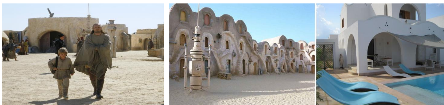
（左・中央：劇中シーン 右：HomeAway物件）

砂漠の惑星タトゥイーンはルークやアナキンの故郷であり、シリーズを通して何度も登場する重要な場所です。『エピソード1 / ファントム・メナス』にはアナキンが生まれ育った町として惑星タトゥイーンのエスパーという都市が出てきますが、これはチュニジア南部の街に大掛かりなセットを組んで撮影されたものです。