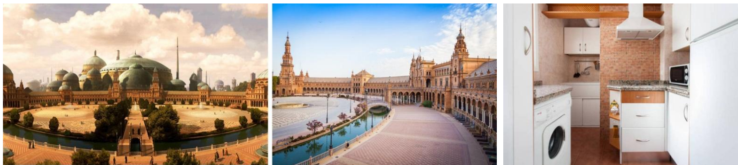
(左：劇中シーン 中央：スペイン広場 右：HomeAway物件)

惑星ナブーは、ナターリー・ポートマンが演じるパドメ・アミダラや帝国軍の初代皇帝パルパティーン（ダース・シディアス）の出身地としてエピソード1から3に登場します。『エピソード2 / クローンの攻撃』では、惑星ナブーに逃げてきたパドメとアナキンが、この広場に降り立ちました。広場のモチーフとなったのは、スペイン南部の都市セビリアにあるスペイン広場です。ホームアウェイには、スペイン広場まで徒歩圏内の部屋もあります。パドメも歩いた回廊で映画気分になりましょう。シンプルで居心地のいい室内には、ベッドルームが2部屋。カップルやファミリーにちょうどいいサイズのこちらの家は1泊9,688円。2人を超えると1人あたり1,938円の追加料金がかかるので、4人で泊まると1人あたり約3,391円です。