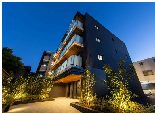
オープンレジデンス桜山ヒルズ

多くのお客様にお選びいただけているのはお客様のニーズにお応えした物件、サービスを提供し続けてきた結果だと思っております。今後もニーズの変化にいち早く対応し、いつまでも選ばれ続けるマンションディベロッパー、不動産会社として精進してまいります。