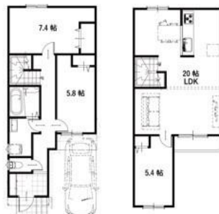
長尾台町 2 区画参考プラン