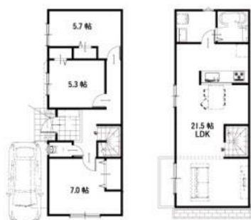
長尾台町 1 区画参考プラン