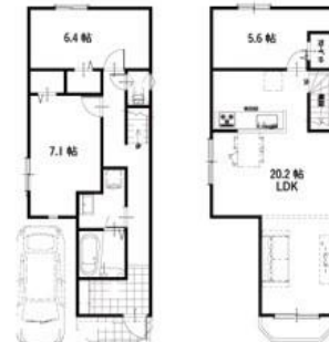
長尾台町 3 区画参考プラン