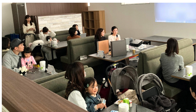
親子連れで来場したイベント参加者

参加者からは、イベントのテーマである「耐災力」(=大きな災害が起こった際に命を守る力)を鍛えるため、日々の中で無理なくできる準備と訓練を日常に取り入れることや、災害時の生活に耐えるための知識をつけることの重要性を実感したというお声を多くいただきました。