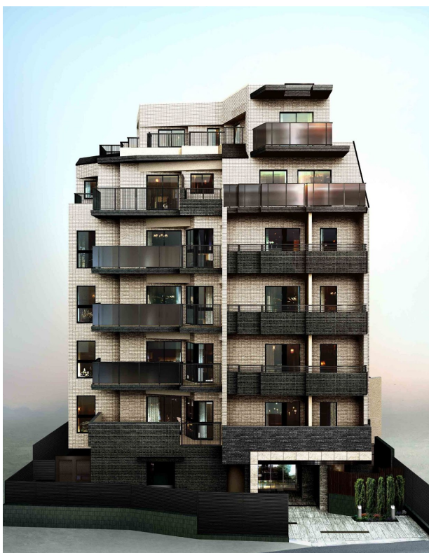
左：オープンレジデンス 四谷舟町、 右：オープンレジデンス 四谷荒木町 ※写真はイメージです。