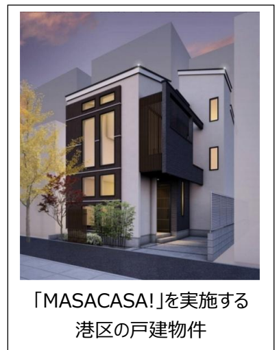
「MASACASA!」を実施する 港区の戸建物件

AI スピーカーの登場が注目を集めているように、IoT、AI、VR といった技術への期待は高まり続けています。多様なデバイスにより私たちの生活がどのように変化するか、また、どのようなサービスやプロダクトが求められるのか。「MASACASA!」では、“1つの家”の中でその答えを模索します。最先端技術により、近い将来、私たちの生活はより便利に、より快適になることは間違いないでしょう。求められる住まいの形も変わるかもしれません。お客様のご要望に合わせた住まいを提供し続けるために、オープンハウスは、ソフトバンクグループと参画いただく企業・団体とともに、イノベーションを創出いたします。