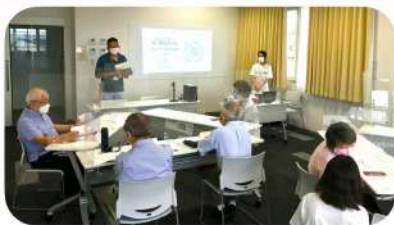
5人1組のチームに参加