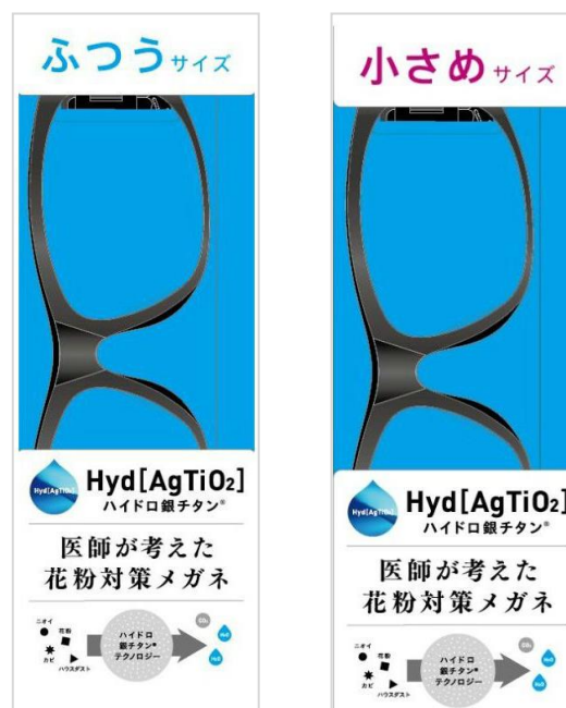
ハイドロ銀チタン®メガネ

今回の「ハイドロ銀チタン®メガネ」は「花粉防止立体ガード」で花粉の侵入を防御する設計はもちろんのこと、フレームにはハイドロ銀チタン®を搭載しており、目の周りに付着する花粉のタンパク質を分解します。