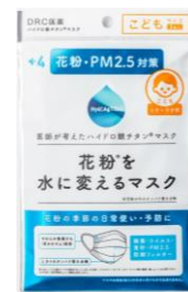
花粉を水に変えるマスク(+4 こども用)