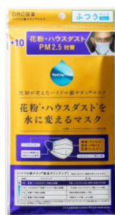
花粉・ハウスダストを水に変えるマスク(+10)