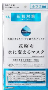
花粉を水に変えるマスク(+4)