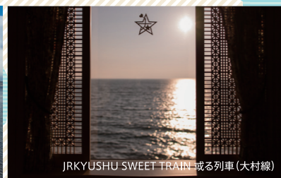
JRKYUSHU SWEET TRAIN 或る列車(大村線)