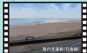
鬼の洗濯板 (日南線)