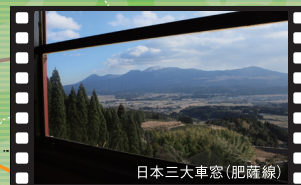
日本三大車窓 (肥薩線)