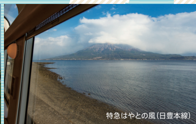
特急はやとの風(日豊本線)