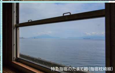
特急指宿のたまて箱(指宿枕崎線)