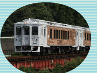
特急海幸山幸 (宮崎～南郷)