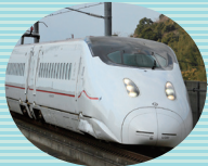
九州新幹線 新800系・800系 (博多～熊本～鹿児島中央)

JR九州では「観光列車」と呼んでいた列車を、 更に旅のイメージを膨らませるようなブランド名に したいと考え「D&S列車」と呼んでいます。「D」 は特別な「デザイン(Design)」、「S」は運行する 地域に基づく「ストーリー(Story)」で、「デザイン と物語のある列車」という意味を込めています。