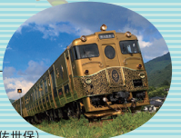
JRKYUSHU SWEET TRAIN 「或る列車」 (大分～日田、長崎～佐世保)