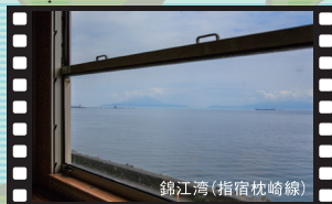
錦江湾 (指宿枕崎線)