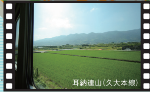
耳納連山 (久大本線)