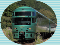
特急ゆいんの森 (博多～由布院・別府)