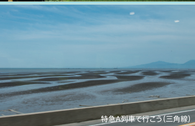
特急A列車で行こう(三角線)