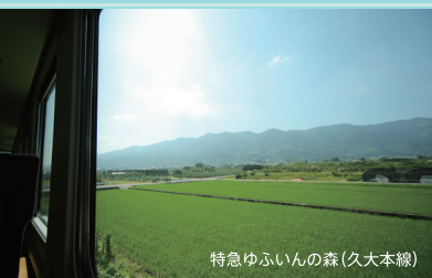
特急ゆいんの森(久大本線)