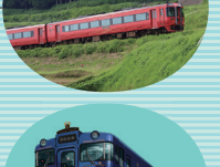
特急かわせみ やませみ (熊本～人吉)