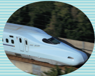
山陽・九州直通新幹線N700系 (新大阪～博多～鹿児島中央)