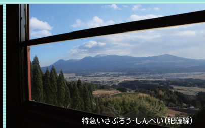
特急いさぶろう・しんべい(肥薩線)