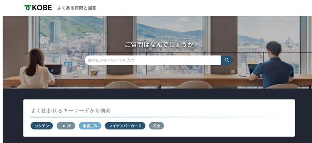
神戸市 FAQ の Web サイト

AI 検索「Cogmo Search(コグモ・サーチ)」を提供する株式会社アイアクト（東京都千代田区、 https://www.iact.co.jp/ 、以下、アイアクト）は、神戸市が運営する複数サイトに、AI 検索によるサイト横断検索を導入し、検索後のページ離脱を減少させる効果をあげました。