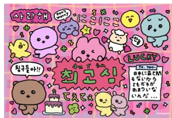
オリジナルポストカード