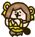
国木田花丸 (CV：高槻かなこ)