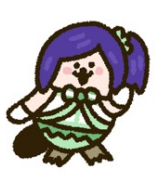
松浦果南 (CV：諏訪ななか)