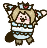
渡辺 曜 (CV：齊藤朱夏)