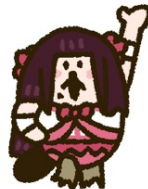
黒澤ダイヤ (CV：小宮有紗)