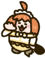
高海千歌 (CV：伊波杏樹)