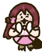
桜内梨子 (CV：逢田梨香子)