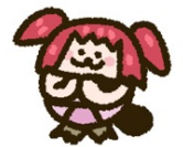
黒澤ルビィ (CV：降幡 愛)