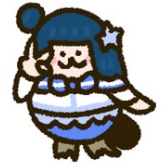
津島善子 (CV：小林愛香)