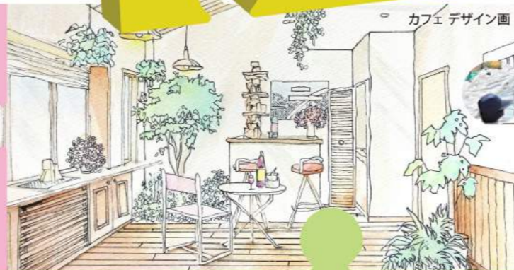
カフェデザイン画