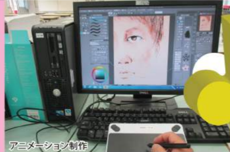
アニメーション制作

本校は科、学校の枠を越えた「学び」—各科での学びを大切にしつつ、各科の特性を融合したものづくり、そして地域との協働による流通までを目指します。身の回りの課題を発見し、自分なりに解決を体験する3年間に共に過ごしましょう。