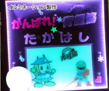
イルミネーション制作