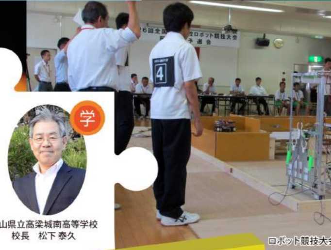
ロボット競技大会