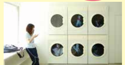
レアンドロ・エルリッヒ「ランドリー」