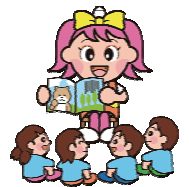
岡山県マスコット うらっち