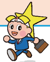
岡山県マスコット ももっち