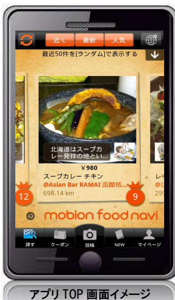
アプリ TOP 画面イメージ

「mobion food navi」は、昨年8月に iPhone 版アプリの提供を開始し、多くのユーザーに楽しんでいただいておりますが、Android ユーザーからも利用希望の声を多くいただいたことを受け、このたび Android 版アプリをリリースすることとなりました。