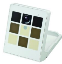
パナソニック Vieureka 対応 スマートカメラ (エリモ社製 VRK-C201)