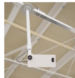
トライアルカンパニー社 スマートカメラ

トライアルが独自に開発した画像認識エンジンと連動したスマートカメラにより、商品棚の商品陳列、商品接触を分析します。商品棚にフォーカスすることで、プライバシーを守りながら商品動向の可視化・定量化が24時間可能になります。