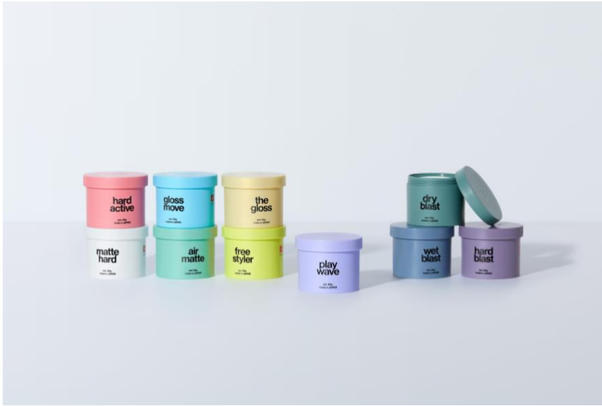
リップスヘア ワックス 各 1,650 円 (税込)

ヘアサロン「LIPPS hair」のサロンワーク視点から生まれたヘアワックスシリーズは、基本的なスタイリング機能は勿論のこと、中味や容器の使いやすさなどプロダクトが持つすべての機能に対して徹底的にこだわって作られています。すべてのヘアワックスは、髪になじみやすいなめらかなテクスチャーになっており、ヘアスタイリングを作り込む際の抜群の操作性を実現しています。基本機能であるスタイリング力はもちろんのこと、現代の男性が求める“カッコよさ”の価値観や感性に寄り添ったパッケージデザインまで、単なるヘアスタイリング剤ではなく、アイテムを持つことで高まる“センスのよさ”を提案しています。