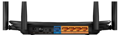
デスクトップ 4K HDTV コンピューター NAS

2.4GHz(11n)では、規格値300Mbpsの無線LAN通信が可能で、メールやネットサーフィンなどの普段使いに使用することができます。5GHzでは合計867Mbpsの無線LAN通信を実現し、ゲームや高画質動画ストリーミング視聴などの通信環境が重要視される場面でも快適なWi-Fi通信を実現します。