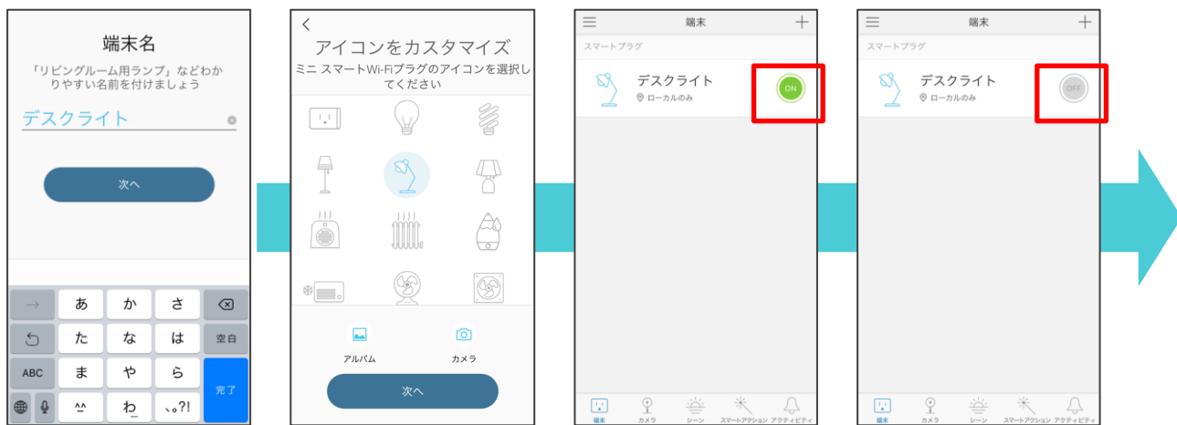
接続する端末の名前を設定