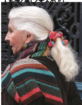
ミシェルンさん 90代 「自然のまま。グレイヘアも『これが私』と深く受け入れる」

パリマダム グレイヘア スタイル 2016年9月16日発売 1500円+税 ISBN978-4-07-416960-3