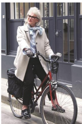
カトリーヌさん 59歳 「白髪でいることで加齢を受け入れていく。その過程が大事だと思う」「何事も受け入れる姿勢が人を美しくするのよ」

2015年7月に発売するや、瞬く間に5万部を売り上げた『Madame Chic Paris Snap』の待望の第2弾は、なんと「グレイヘア」の女性達の写真集です。美しい年の重ね方のお手本は、やはりパリマダム。主婦の友社では、すでに2年以上前からグレイヘアに着目し、累計6万6千部の60歳以上の女性の写真集『OVER60 Street Snap』『OVER60 Street Snap II』では、美しい白髪の女性が表紙を飾っております。アメリカでも、「Going Gray Looking Great」というグレイヘアを特集した本が人気で、「ありのままが美しい」と、いま世界でグレイヘアを選択する生き方が注目されています。