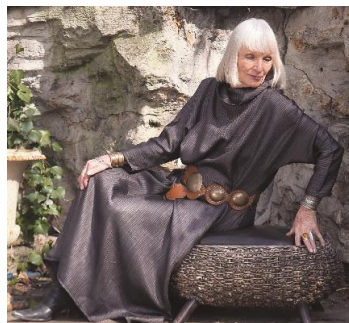
ポニーさん 79歳 どうして人は髪を染めるのかしら？髪を染めると、見た目は若く見えるかもしれないけれど、染めようと思う心が、逆に人を老けさせるのよ。髪を染めて別人になる必要はないわ。そのままの自分でいたい。