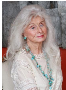
エドモンドさん 76歳 「他人と同じになるのはイヤ。オリジナリティこそが最上」