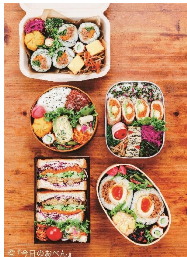
◎「今日のおべん」 ▲同じおかずでも見え方が全く違う！

土日に13～16種類のおかずを作りおきするというtamiさん。1週間分の食材(肉2割、野菜7割)は、緑、赤、黄、紫色があれば特別なものは必要ありません。食材をメニューごとに切りわけ、おかずを作ります。この時、それぞれのおかずが調和するように味つけしたり、おかずの切り方を変えたりすることがポイントです。