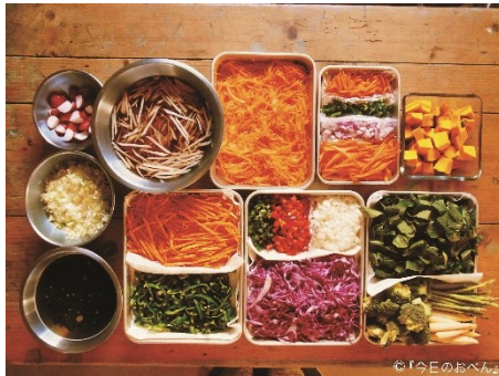
▲メニューごとに切りわけます。