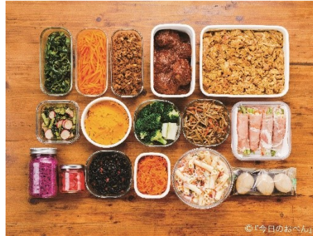
▲どれも詰めてもバランスよしの作りおき。