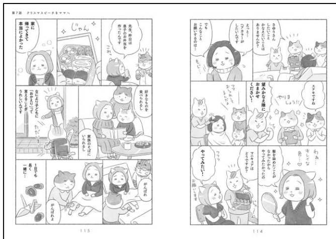
第3話「クリスマスピーチをママへ」より