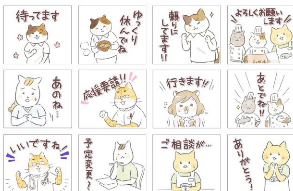
「ねこマンガたんぽぽ先生」スタンプ 一例

原作マンガのイラストそのままに、たんぽぽ先生を中心に、看護師、理学療法士、作業療法士、調理師、ケアマネージャー、ソーシャルワーカー、管理栄養士、言語聴覚士、秘書、専務理事など多くの職種のねこたちがスタンプに。「応援要請」「至急!!!」「すぐ向かいます」「了解です」「予定変更」など、日常シーンから介護や医療のシーンでも役立つ40種類で、ソフトでやさしいイメージのスタンプです。