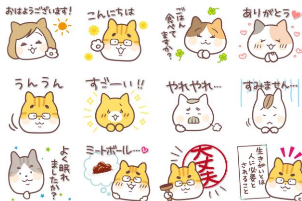
「ねこマンガもちっとたんぽぽ先生」スタンプ

おもちゃみたいで、もちもちしたかわいらしいタッチが特徴のほっこり&いやされる40種類のスタンプです。「ごはん食べてますか?」「どうされましたか?」「よく眠れましたか?」「大丈夫」などひとことで伝わるスタンプが多数。さらに、たんぽぽ先生のモットー「生きがいは人に必要とされること」のスタンプも!