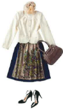
エレガントに着的る