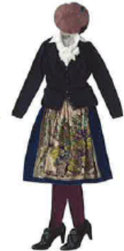
ガーリーに着的る