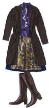
ソフィスティケートに着的る